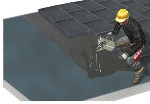
Platten vollflächig in Heißbitumen verlegen