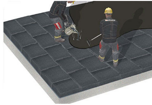
Zellfüllenden Deckabstrich aufbringen