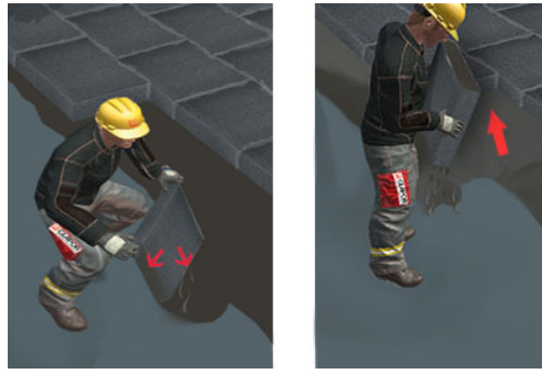
Platten diagonal einschieben