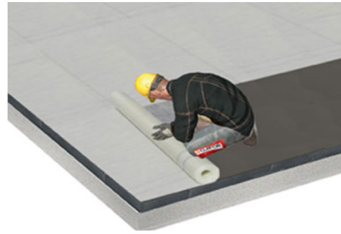
Kunststoffabdichtung lt. Herstellervorschrift