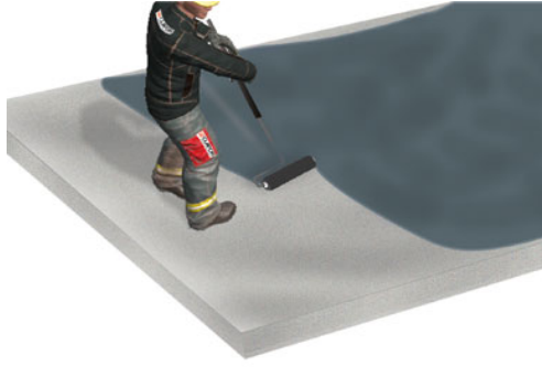
Reinigen und Grundieren