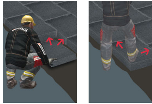
kurzzeitig gegen Verrutschen sichern