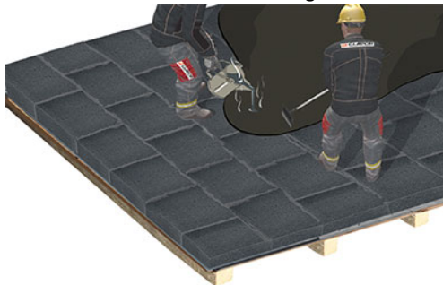
Zellfüllenden Deckabstrich aufbringen