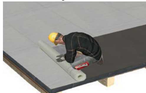
Kunststoffabdichtung lt. Herstellervorschrift