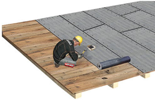
Reinigen und Trennlage verlegen