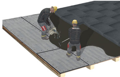
Platten vollflächig in Heißbitumen verlegen