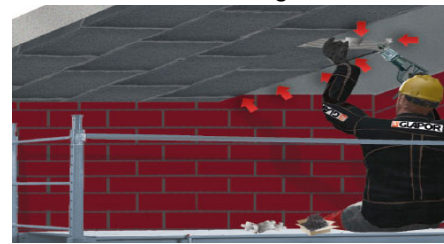
Platten mechanisch befestigen