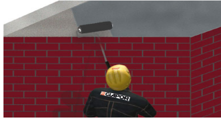
Reinigen und Grundieren