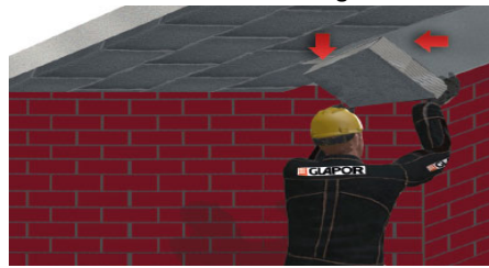
Platten auf Deckenfläche verlegen