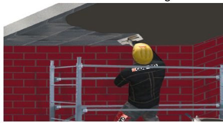
zellfüllenden Deckabstrich auftragen