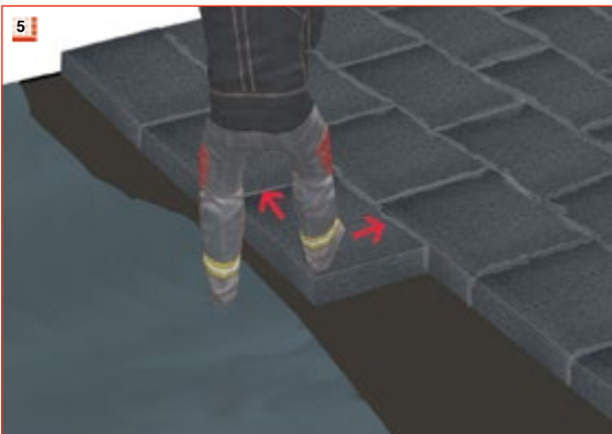
5 Dämmplatte kurzzeitig gegen verschieben sichern. Je nach Ebenheit des Untergrundes. Verbrauch: 5 bis 8 kg/m 2 .