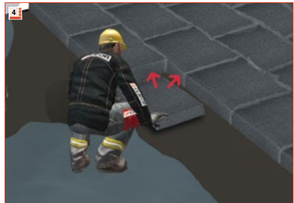
4 ...und diagonal einschieben, damit die Längs- und Querfugen mit Bitumen gefüllt werden.