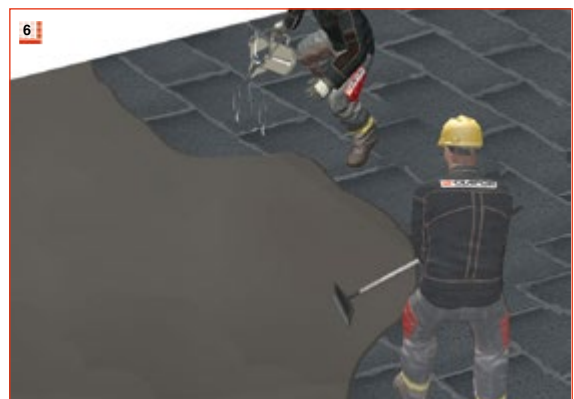
6 GLAPOR flex Heißbitumenmasse ausgießen und mit einem Gummischieber auf der Schaumglasoberfläche verteilen. Deckabstrich mit GLAPOR flex Heiß- bitumen. Verbrauch ca. 2,0 kg/m 2 .