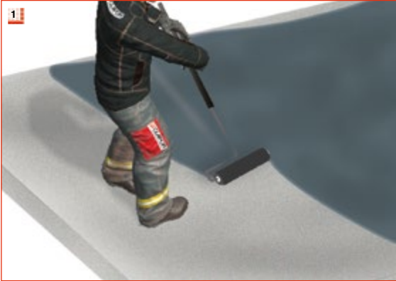
1 Dachfläche säubern und mit Bitumen- voranstrich / Bitumenemulsion vorstreichen und ablüften lassen. Verbrauch: ca. 0,3 kg/m 2 .