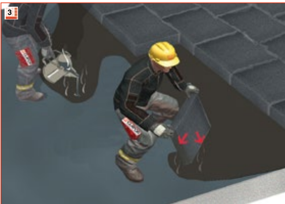
3 GLAPOR flex Heißbitumen ausgießen, die Dämmplatten mit zwei Seiten in die Klebemasse eintauchen...