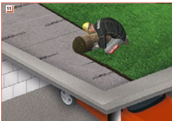
11 Extensives oder intensives Gründachsystem auf dem GLAPOR Geotextil nach den Herstellervorschriften des Gründachherstellers einbauen.