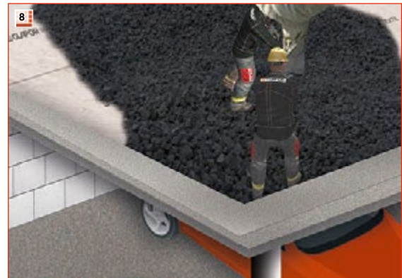
8 Schaumglasschotter mit Überhöhung einbauen und verteilen. Überhöhung je nach Belastung der Schotterschicht 1,2 bis 1,3.