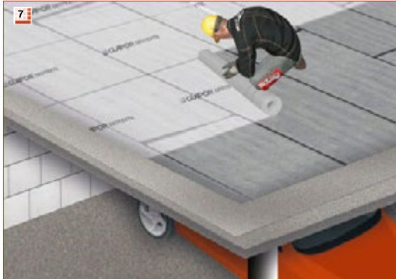
7 Trenn- und Schutzlage aus einem GLAPOR Geotextil mit 10 cm Stoßüberdeckung auf der Abdichtung verlegen.