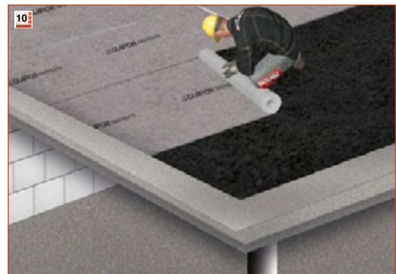
10 GLAPOR Geotextil als Trennlage auf die Dämmschotterschicht verlegen.