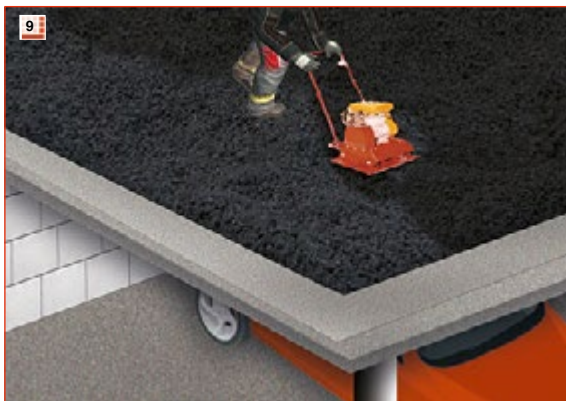
9 Das verdichten von GLAPOR Schaumglasschotter erfolgt mit einer leichten Rüttelplatte*.